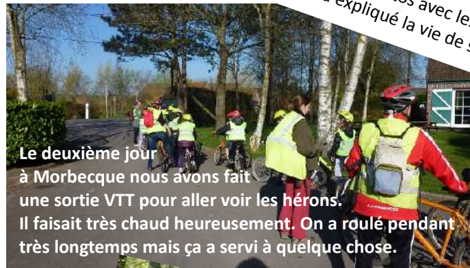
Le deuxième jour à Morbecque nous avons fait une sortie VTT pour aller voir les hérons. Il faisait très chaud heureusement. On a roulé pendant très longtemps mais ça a servi à quelque chose.