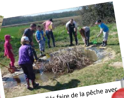
Nous étions allés faire de la pêche avec des cannes à pêche rouge et jaune, nous avons pêché plein de choses, nous sommes bien amusés.