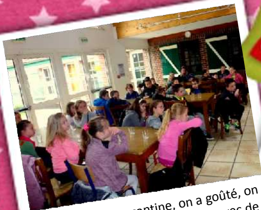
Dans la salle de cantine, on a goûté, on a mangé un gâteau, on a bu un verre d'eau avec de la menthe. On a eu le droit à un deuxième gâteau après on est parti jouer dehors.