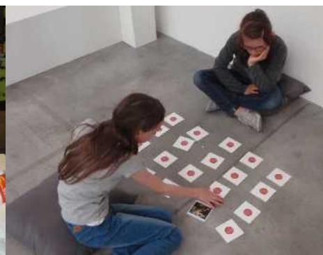
Le vendredi 22 mai, on a joué avec les jeux de société du musée ( au loto et au mémory). On a passé une très bonne journée à Lille. Wendy