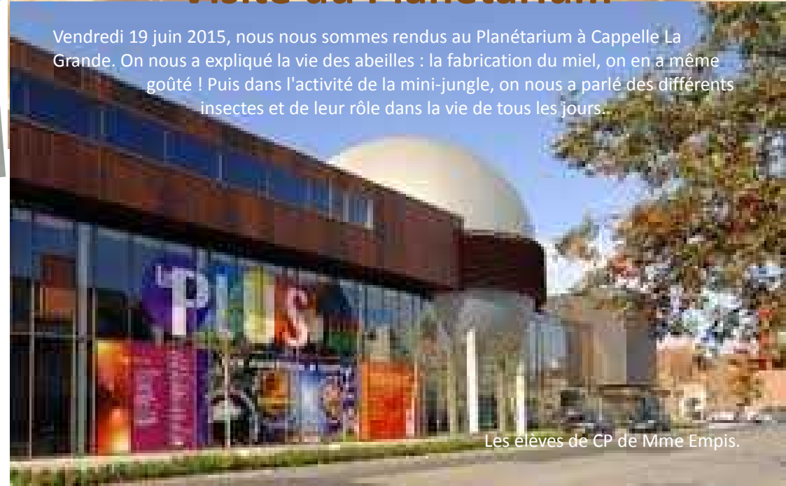
Les élèves de CP de Mme Empis.

Vendredi 19 juin 2015, nous nous sommes rendus au Planétarium à Cappelle La Grande. On nous a expliqué la vie des abeilles : la fabrication du miel, on en a même goûté ! Puis dans l'activité de la mini-jungle, on nous a parlé des différents insectes et de leur rôle dans la vie de tous les jours.