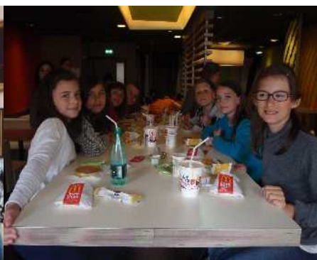
Petite sortie au Mac do à Lille. Très très bonne journée. Ps : Mmmm que c'était bon !