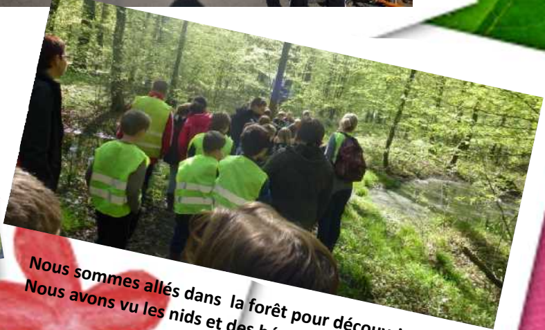
Nous sommes allés dans la forêt pour découvrir les hérons. Nous avons vu les nids et des hérons avec des jumelles.