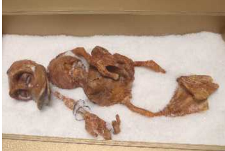
Voici le squelette de Donald mais il est en papier mâché!