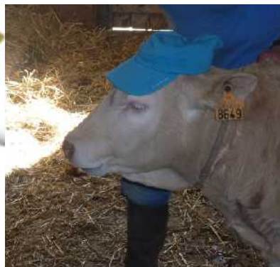
Le troisième jour nous sommes allés à la ferme nous avons appris l'utilisation du diable et autre chose nous avons aussi appris les graines de blé etc nous avons aussi pu porter un poussin.