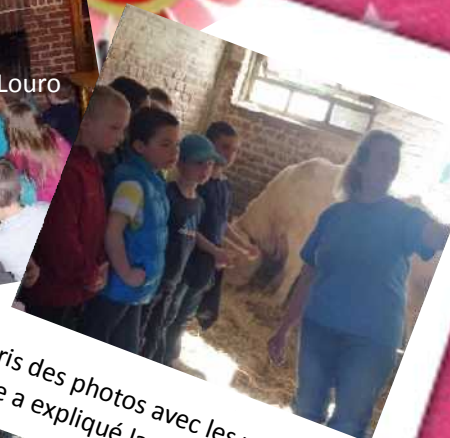
On a pris des photos avec les veaux. La dame a expliqué la vie de ses animaux.