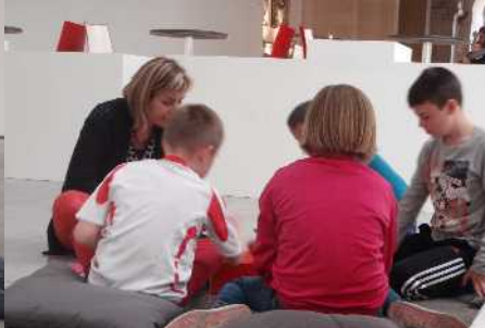
Nous étions en train de jouer à un jeu . Nous avons bien joué, moi j'étais deuxième.