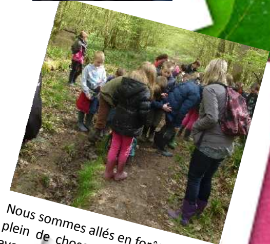
Nous sommes allés en forêt apprendre plein de choses sur la nature . Nous avons eu la chance de voir des empreintes d'animaux.