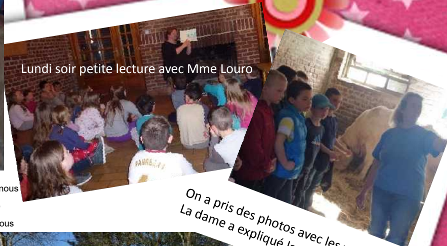
Lundi soir petite lecture avec Mme Louro