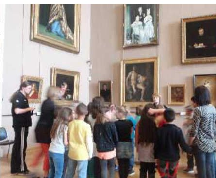
Nous sommes tous ensemble au musée de Lille et une dame nous explique des choses sur l'histoire des tableaux.